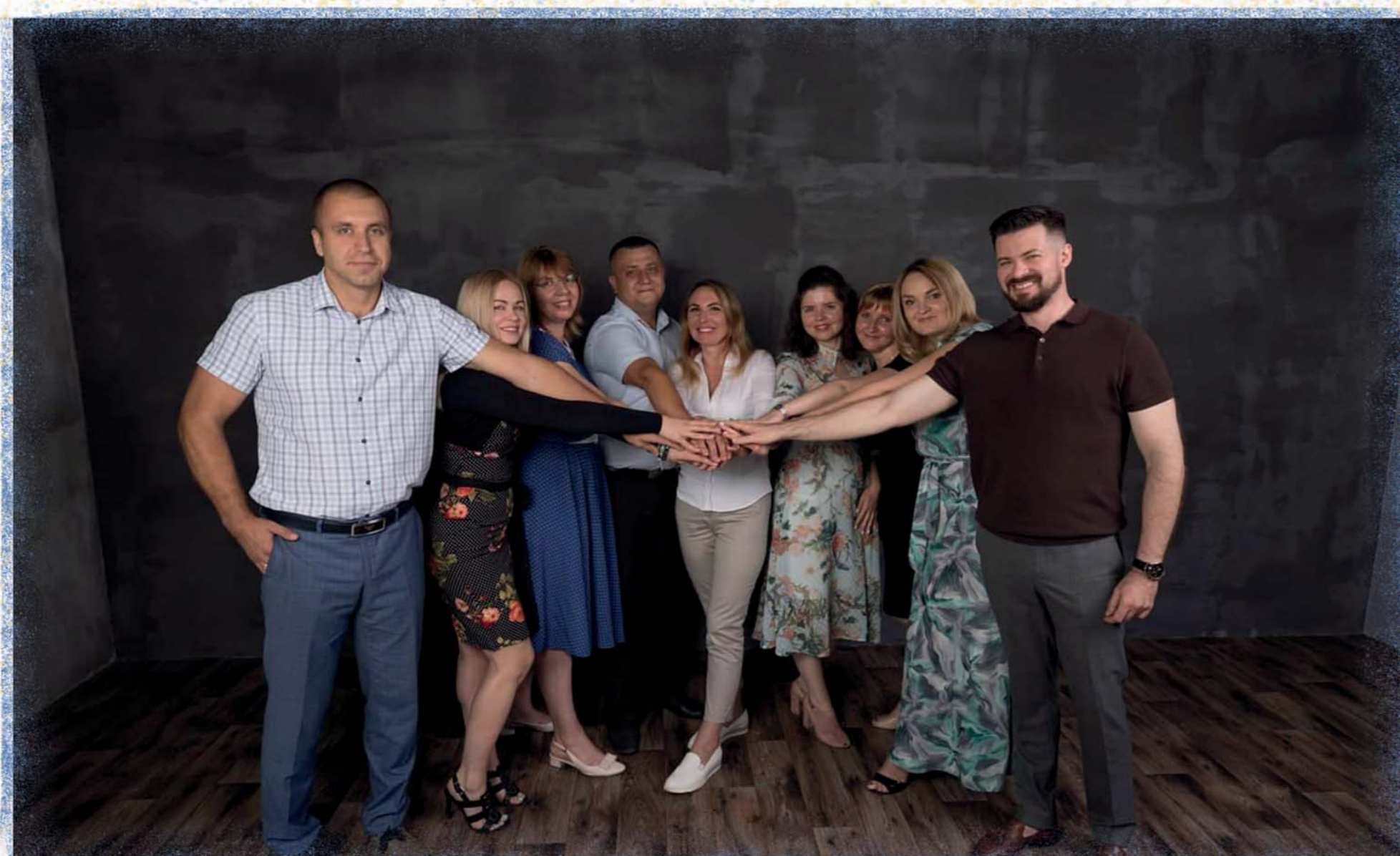
Право Є, Архів

Якщо громадянин України хоче отримати поточну інформацію про рівень забруднення повітря у своєму регіоні, він повинен подолати низку перешкод. В Україні не існує єдиної загальнодержавної системи моніторингу повітря. Як результат, ці дані знаходяться в різних структурах, і їх наявність та якість значно різняться залежно від регіону. В одних областях ці дані є легкодоступні, в інших можна отримати дані із затримкою, а в інших областях ці дані взагалі відсутні в Інтернеті. Оскільки держава не може чітко консолідувати цю інформацію, громадські організації виступили з цією ініціативою.