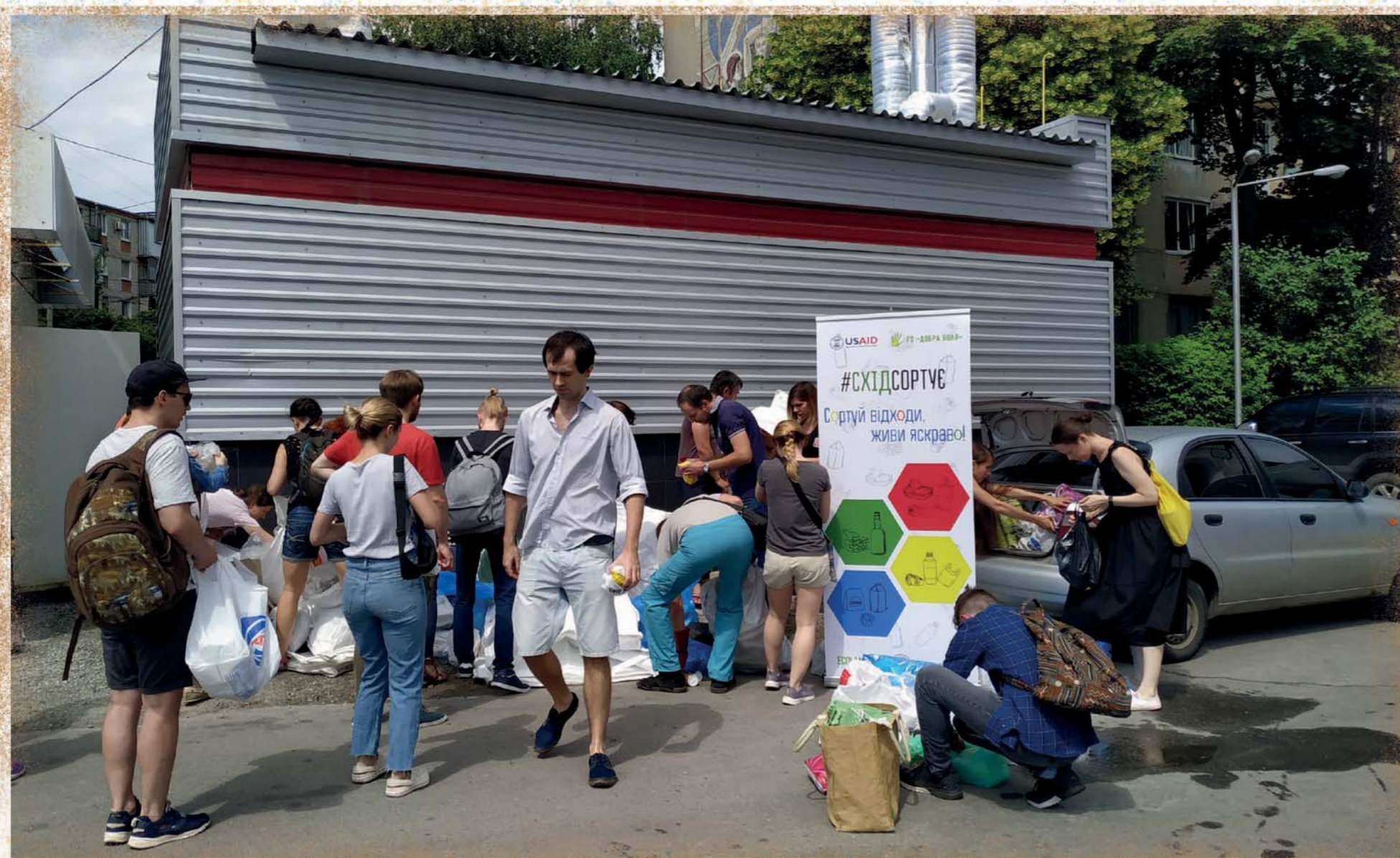
Архів, Добра воля

Навесні 2020 року також проводились дослідження природних забруднювачів поблизу житлових населених пунктів. Проби води, ґрунту та повітря піддавались лабораторним випробуванням. Ліміти перевищені та результати були опубліковані у Фейсбук та на веб-сайтах.