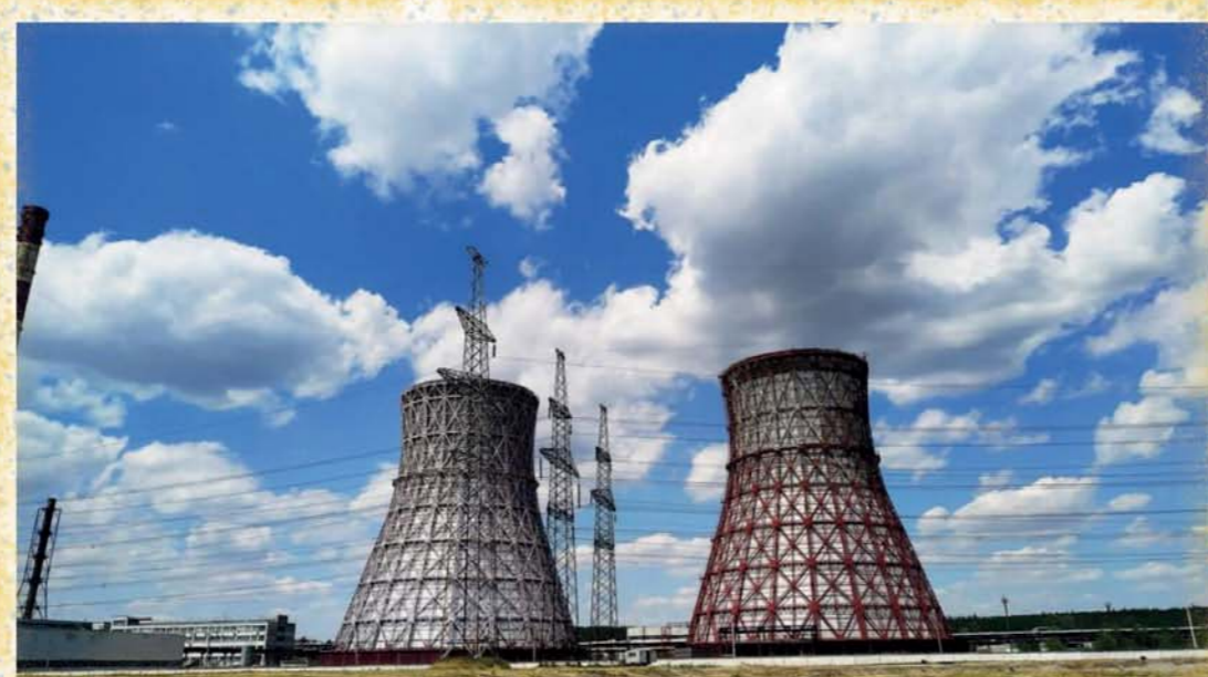
1 - СвіссКроно-виробник меблевих плит, Ксения Тумановская (Добра воля), 2 - Архів, Добра воля, 3 - Харківська теплоелектроцентраль №5 - одна з найпотужніших в Україні, Ксения Тумановская (Добра воля)