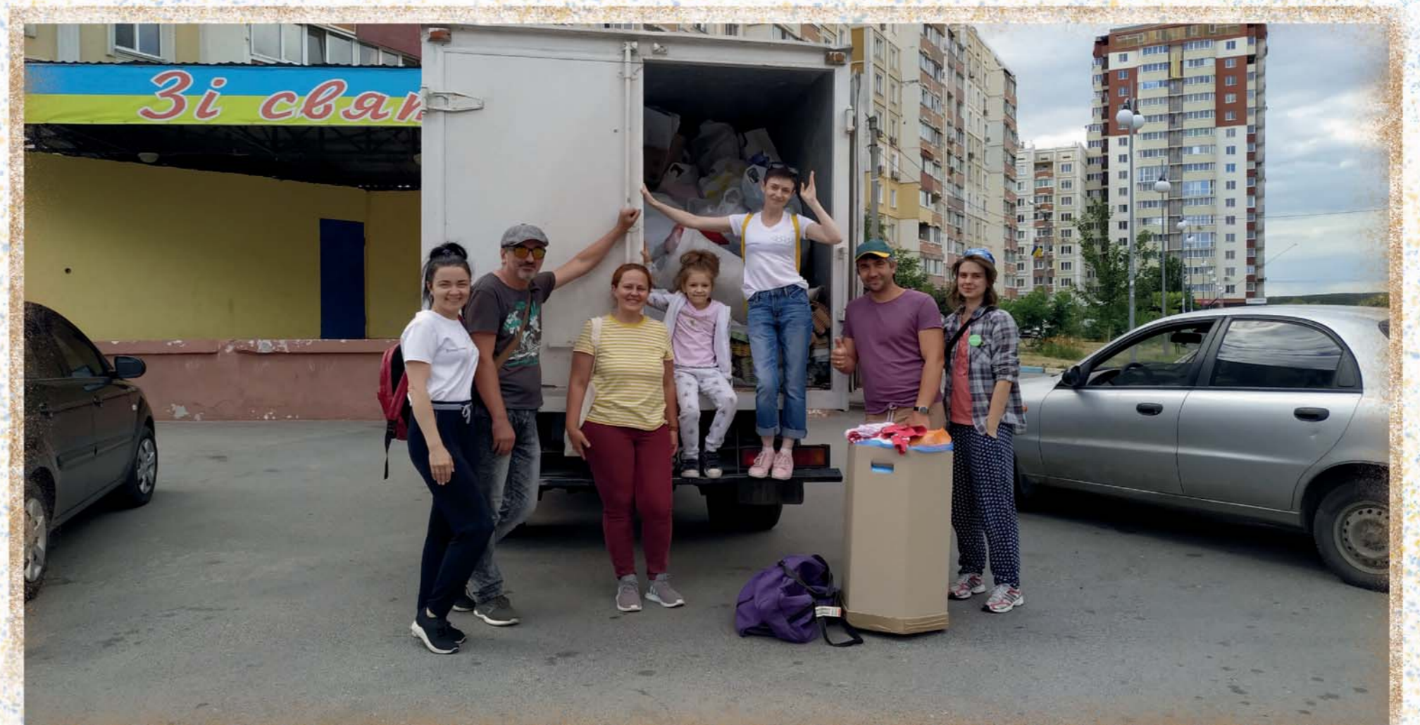
Архів, Добра воля