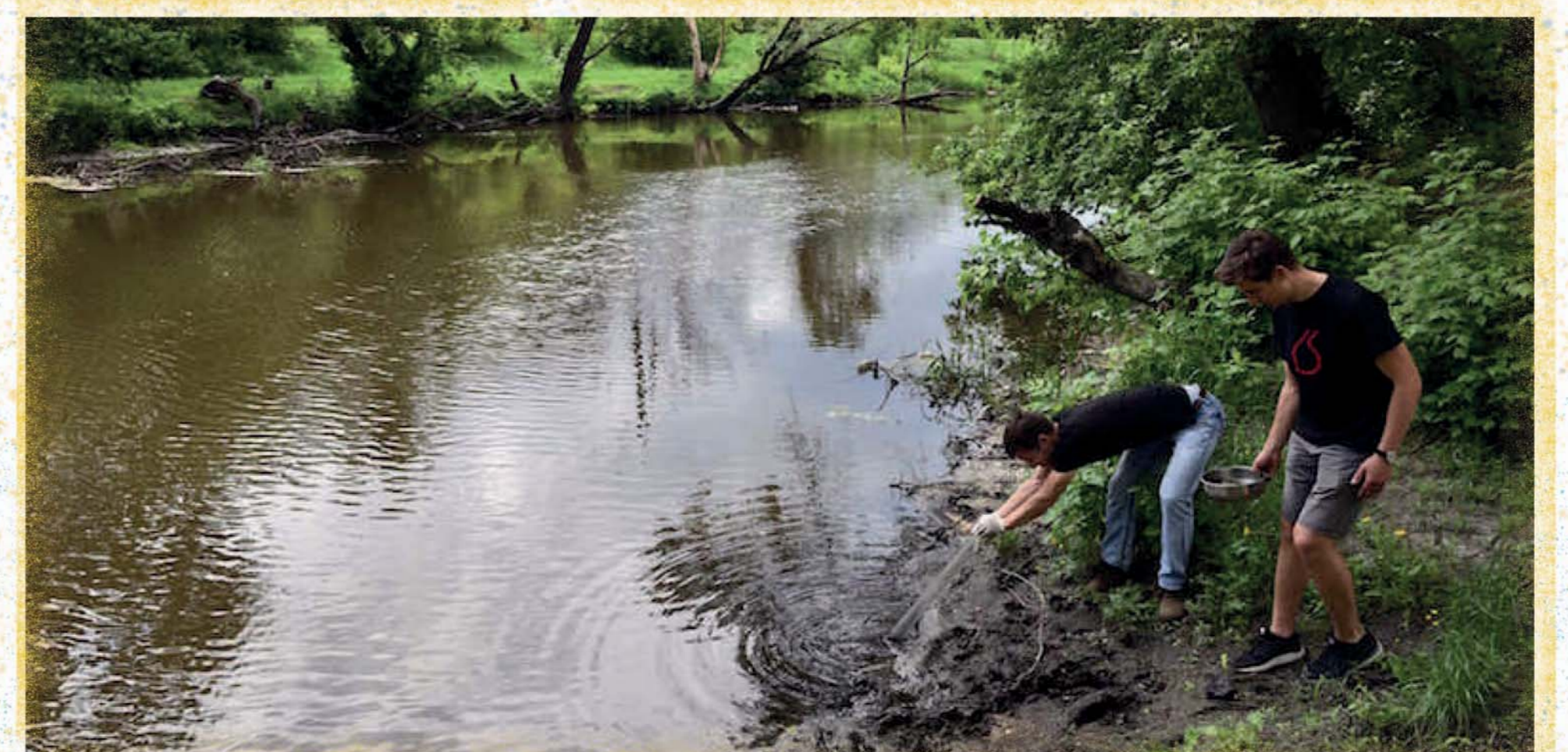
Харків, архів Арніка

Харківська теплоелектроцентраль №5 – одна з найпотужніших в Україні. Вона розташована поблизу села Подвірки в Дергачівському районі Харківської області і призначена для забезпечення електричною і тепловою енергією побутових, промислових і бюджетних споживачів міста Харкова та прилеглих до неї селищ.