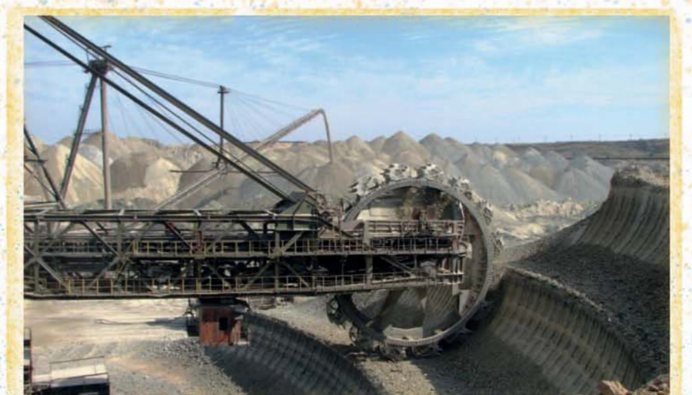
Нікопольський феросплавний завод / Проммайданчик колишнього Південнотрубного заводу Запорізька АЕС та ТЕС - вид з Набережної Нікополя / Покровський ГЗК