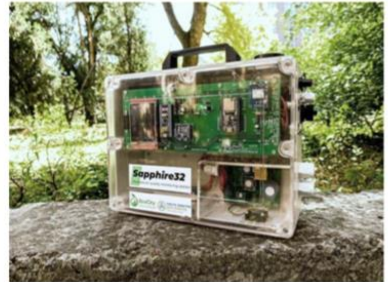
Sapphire32 - мобільна станція моніторингу якості повітря