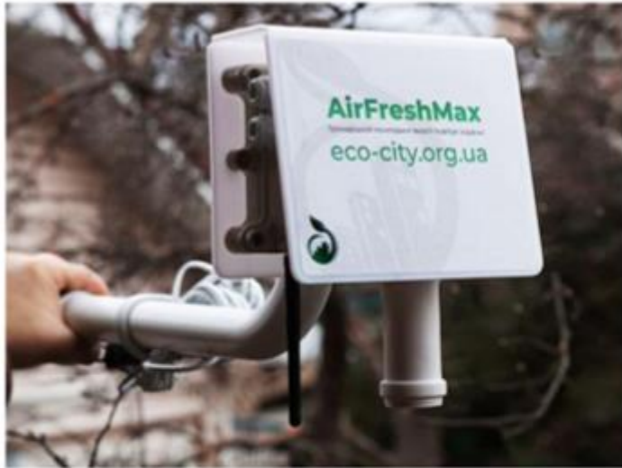
AirFresh Max - зовнішня станція моніторингу якості повітря